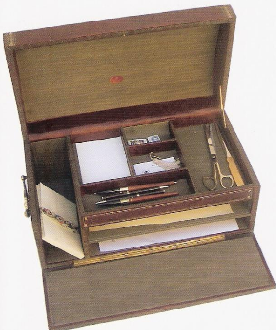
Piccolo baule contenente oggetti per ufficio Small trunk containing office supplies

Pelle di montone e legno / Leather and wood 22 x 45 x 26 cm.